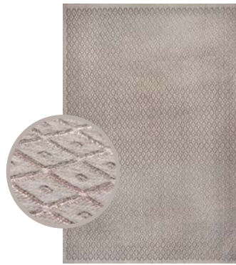
Grigio Chiaro 9039