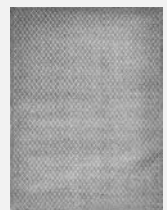
300 × 400 ¥450,000