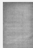
240 × 340 ¥320,000