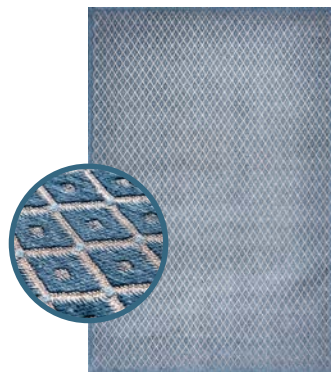
Blu Grigio 9036