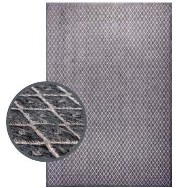
Grigio Scuro 9040

ミクロな幾何学模様が広がるレトロクラシックなデザインにお馴染みのベルギーの最新のカラーでモダンに仕上げた「Splendore」シリーズ。レトロモダンな「Nuovo」とクラシックモダンな「Rombo」の2種類展開。